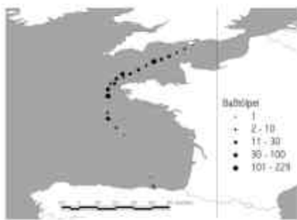
Abb. 2 Verteilung des Baßtölpels entlang der Fahrtstrecke

Baßtölpel ( Sula bassana ): 7.9. ca. 435, davon knapp 70 % ad, v.a. über dem Kontinentalschelf, also im verhältnismäßig seichteren Abschnitt; 8.9. 4 unweit der spanischen Küste; 9.9. vom Golf bis zum Beginn des Ärmelkanals 337 (85 % ad), im Ärmelkanal dann nur mehr 31 (bis auf 1 imm. alle ad).