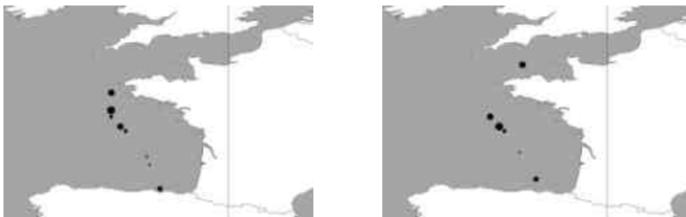
Abb. 3: Verteilung der Delfine (links) und Wale (rechts) während der Fahrt

Schweinswal ( Phocoena phocoena ): 7.9. 1.