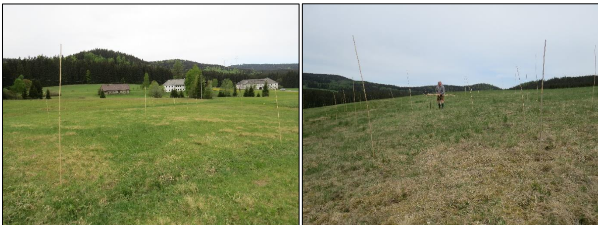
Abb. 1 + 2 : Ausbringen temporärer Sitzwarten-Cluster in der Dürnau, 2.5.2018

Ziel war es, je Hektar potenzieller Brutwiese 100 bis 150 Stäbe mit ca. 1,2 bis 1,5 m Höhe in zwei bis drei Clustern anzubringen. Ca. 1000 bis 1200 Stäbe sollten so die strukturarmen Braunkehlchen-Habitate aufwerten. Nach Rücksprache mit 6 Bewirtschaftern konnten insgesamt ca. 800 Stäbe in 14 Clustern in den ersten Maitagen gesteckt werden.