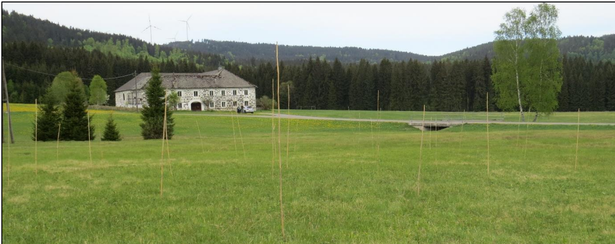
Abb. 5: Warten-Cluster aus Elefantengras in strukturarmer Feuchtwiese, Dürnau, 2.5.2018

Die Cluster in einer Mähwiese auf einer Kuppe, mit Mahd am 25.6. Juni, wurden nur zur Nahrungsaufnahme nicht jedoch als Brutplatz genutzt. Die Warten wurden zudem von Wiesenpieper und Neuntöter als Sitzwarten verwendet. Mindestens 7 Wachtelkönig-Pullis wurden vom Landwirt in den Wiesen beobachtet.